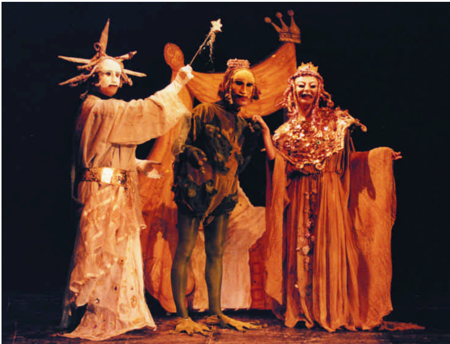
La Fata rompe l'incantesimo