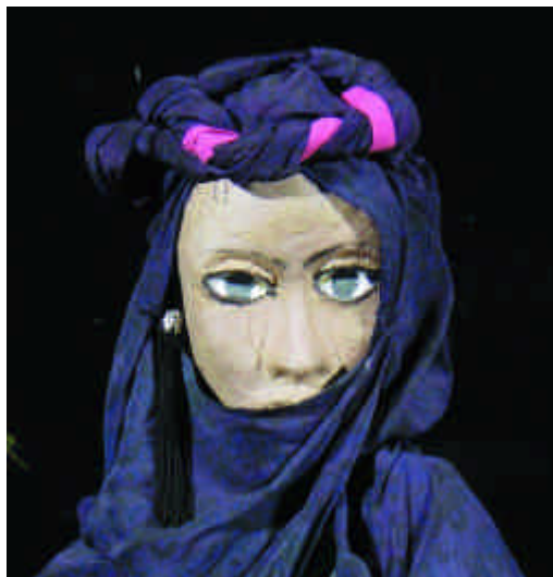
Le sorelle di Zippora