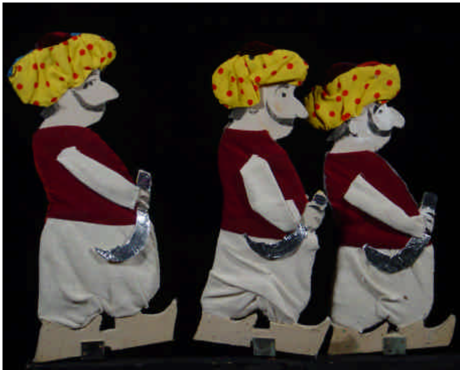
...e dopo aver bevuto